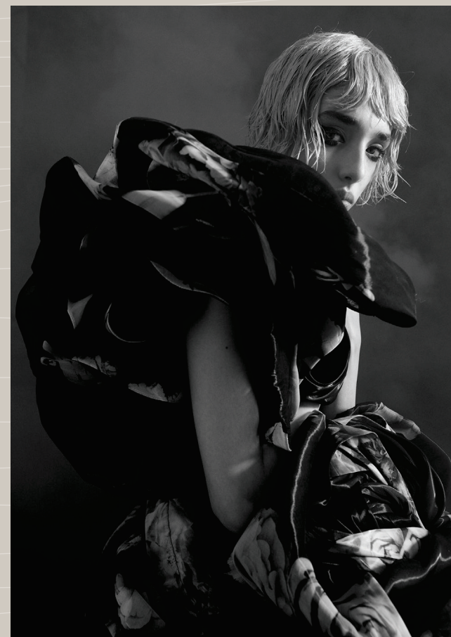
Tatler — Hong Kong

— Fue finalista en la AHFA - Peluquería del Año, en 2016, 2017, 2018 y 2019, llevándose a casa el título de Peluquero Masculino Australiano del Año en 2016 y 2019.