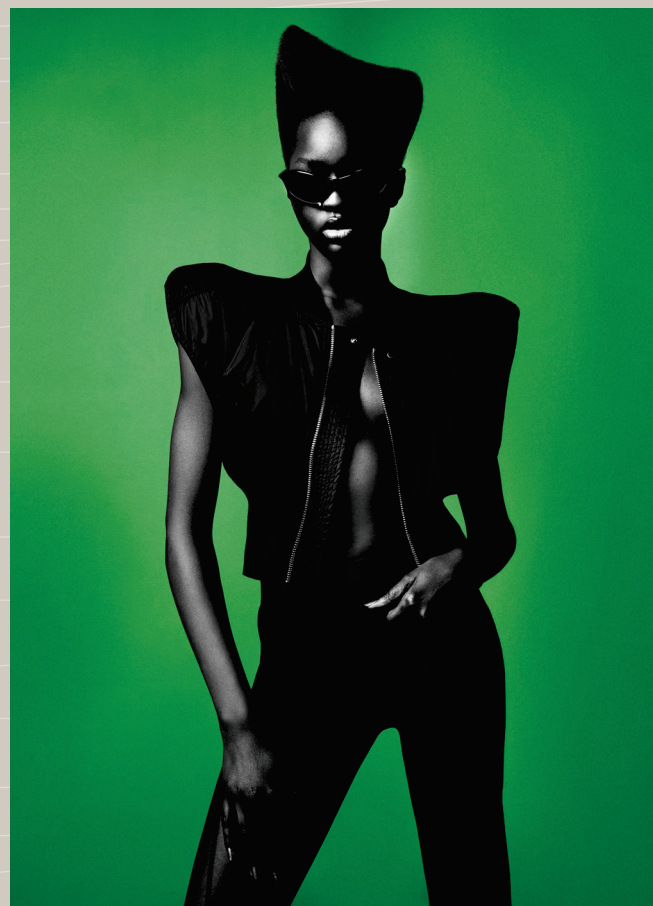
Icon Issue — The Journal Magazine